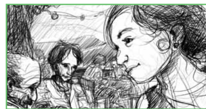
Dessin: Sébastien Guenot

Si le cœur vous en dit, vous pouvez encore vous inscrire auprès de l'administration communale de Cully ou directement sur le site internet: www.legarconsavoyard.ch .