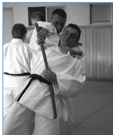
Nos techniciens pendant un entraînement de kata.

«A Tokyo, poursuit notre interlocuteur, notre guide nous a conduits au Musée du Judo situé dans la maison du Kodokan, l'équivalent pour les judokas de tous les pays du monde du Vatican pour les catholiques ou de La Mecque pour les musulmans. Dans ce centre culturel et sportif, véritable Université du Judo, nous avons suivi un stage international réservé aux professeurs de divers pays. Pendant quatre jours, nous avons reçu l'enseignement des plus grands maîtres, tous titulaires du plus haut grade du judo, le 10 e dan, certains anciens participants aux Jeux Olympiques, d'autres extraordinaires professeurs âgés de plus de 80 ans. Nous y avons découvert une technique d'entraînement plus autoritaire qu'en Europe avec un total respect du Maître. A raison de deux cours intensifs de kata par jour, c'est-à-dire de simulations de combat, nous nous sommes très rapidement améliorés sur les plans de la technique, de la gestuelle et de l'esprit. Nous ne doutons pas d'en faire bénéficier nos élèves. Nous avons approfondi les bases de notre discipline dans un esprit plus ouvert sur l'être humain; un gain de confiance en est résulté et surtout nous avons davantage acquis les notions philosophiques, lesquelles sont part intégrante de notre sport. Le judo est un art de vivre et nous l'avons perçu intensément.»