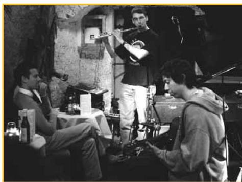
Ambiance du Caveau le Pouf