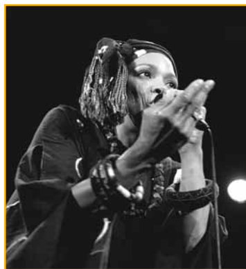
Dee Dee Bridgewater

Les stars invitées à Cully cette année n'ont pas déçu les attentes du public. Manu Katché , Agnès Jaoui , Dee Dee Bridgewater et Marianne Faithfull ont fait vibrer le Chapiteau sous les regards conquis de leurs