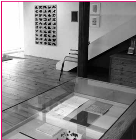
La galerie davel 14