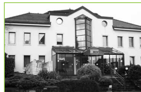
Le futur bâtiment communal

On ne peut donc que se réjouir d'avoir saisi la balle au bond! Une occasion pareille ne se présente pas tous les jours.