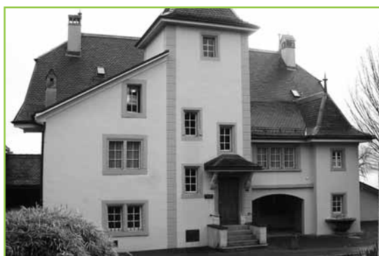
La Maison Jaune

Comme vous avez pu le lire dans la presse, la commune de Cully a eu l'opportunité d'acquérir cet immeuble, sis à la rue de Lausanne 2, juste en face de la Maison Jaune, suite à un préavis urgent de la Municipalité et grâce à son acceptation, à l'unanimité de son Conseil communal.